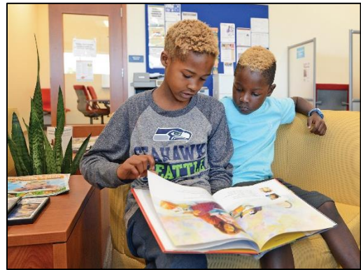
对Mariner图书馆的反响反映了当地居民对服务和聚集场所的渴求。