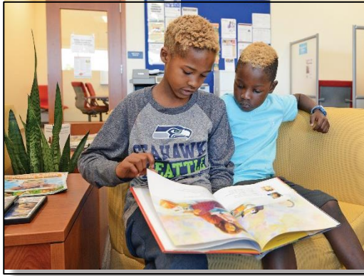
تعكس استجابة مكتبة مارينر رغبة سكان المنطقة في الحصول على الخدمات ومكاناً للتجمع

يرتكز تمويل المرحلة الأولى على اعتماد ميزانية الرأسمالية من ولاية واشنطن. كما يُقدم دعم إضافي في شكل موارد التوظيف من قبل مكتبات سنو-آيل وغيرها من الجهات المعنية العامة وغير الربحية.